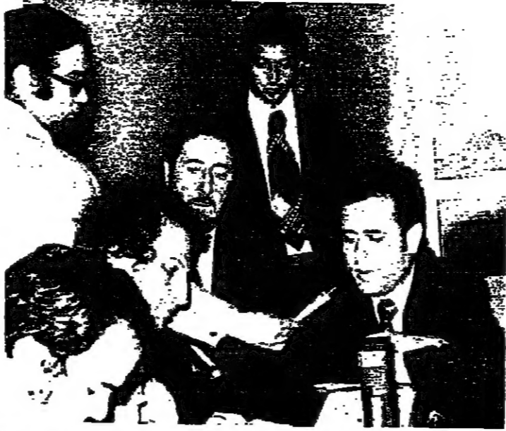
السيد عبد العظيم خدام واللواء ناجي جميل أثناء وجودهما في بيروت